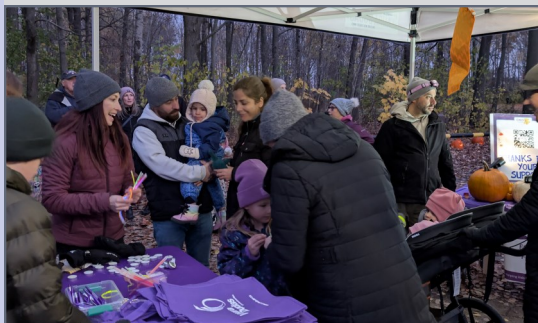
Le sentier des citrouilles à l'École élémentaire catholique L'Étoile-de-l'Est.