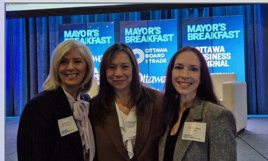
Au petit-déjeuner du maire organisé par la Chambre de commerce d'Ottawa avec des chefs d'entreprise locaux.