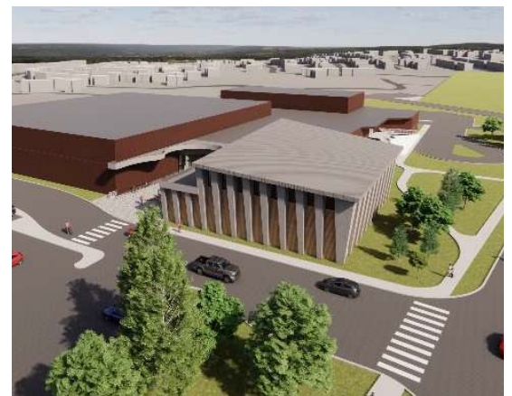
Le futur ajout du gymnase au Complexe récréatif Bob MacQuarrie – Orléans

Et ce n'est pas tout. Bien que cela ne figurait pas dans le budget préliminaire, le resurfaçage des terrains de tennis aux parcs Bilberry et Racette, ainsi que le remplacement des patinoires extérieures aux parcs Barrington et Bearbrook, ont également été ajoutés. Ces améliorations importantes n'ont été possibles que grâce à mon plaidoyer constant et à ma détermination à livrer des résultats pour notre communauté.