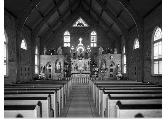
Intérieur de la chapelle de la Villa Saint-Louis, Orléans, vers 1956

Aujourd'hui, la tragédie de la Villa Saint-Louis demeure un chapitre sombre de l'histoire d'Orléans, rappelant la vulnérabilité des petites communautés face aux catastrophes imprévues. Des monuments et des récits historiques préservent la mémoire des